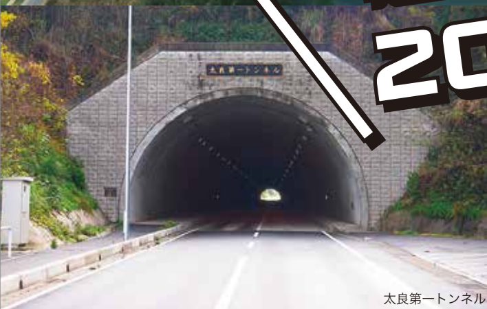
太良第一トンネル